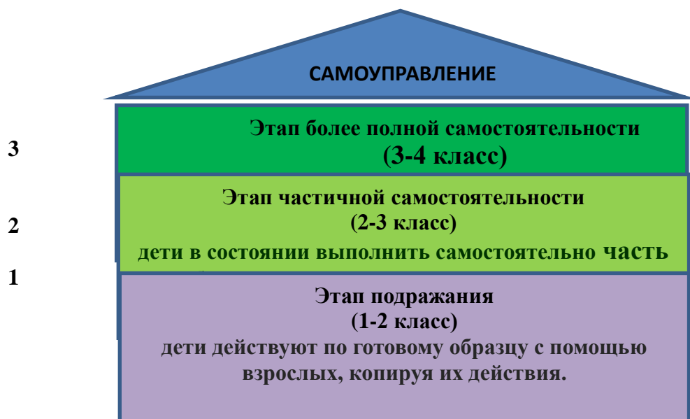
Схема развития ученического самоуправления в младших классах организовано в форме игры-путешествия в сказочное королевство «Дивногорск»